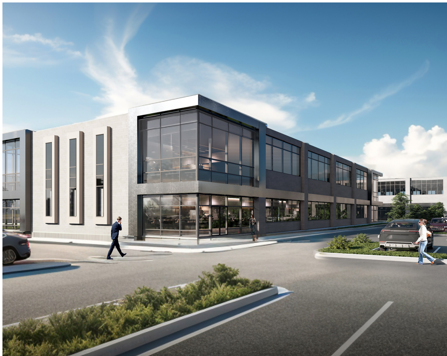
OPTION 1: Option potentielle Potential option